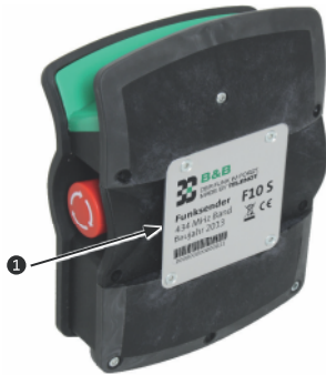
Montage Leibgurt an Sender F10 S

Der Sender der Funksteuerung F10 kann mit dem im Lieferumfang enthaltenen Leibgurt an der Hüfte getragen werden. Dazu muss der Leibgurt an den Sender montiert werden: